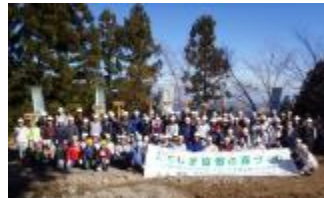
神山町の方と総勢130名で植栽