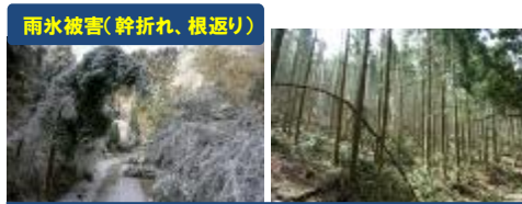
雨水被害(幹折れ、根返り)