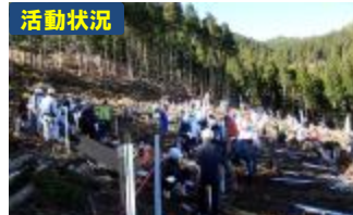
活動状況 植栽、シカ食害防止チューブ設置