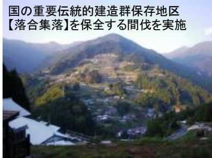
国の重要伝統的建造群保存地区 【落合集落】を保全する間伐を実施